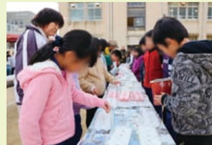
ろうそくづくり たまごパックで再生ろう約1万個を作成。

阪神淡路大震災の追悼行事を主催している実行委員会は、毎年12月に区内外の小中学校や幼稚園・保育園で子どもたちと一緒に震災、防災について考えています!