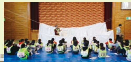
ロープとブルーシートでつくる プライバシー確保の間仕切りの作り方の体験