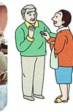
70歳以上の方へ歩行杖の交付