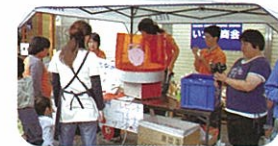
ボランティアグループ サンタ団活動風景