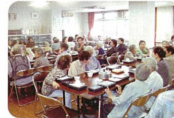
ひとり暮らし高齢者給食会の支援

高齢者の皆様が安心して地域で過ごせるよう、区内7ヶ所のあんしんすこやかセンター(高齢者の相談窓口)に見守り推進員を配置し、民生委員と連携して、住民のみなさん同士のたすけあい活動を応援しています。