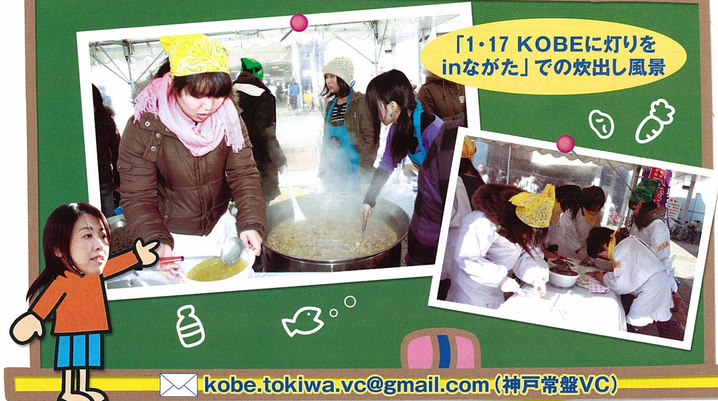
「1・17 KOBEに灯りを innagata」での炊出し風景